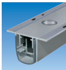
Planet R0 con orificio redondo Ø 10,8 mm. Ver capítulo Pasador | Perforado