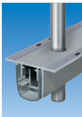
Planet R0 con falleba Ø 10 mm. Ver capítulo pasador | perforado