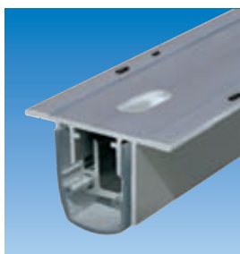
Planet R0 con orificio 5×13 mm. Ver capítulo Planet KR | Perforado