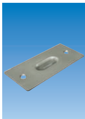
Planet BM 5×13 mm cubeta de suelo estrecha, ver capítulo Pasador | Perforado