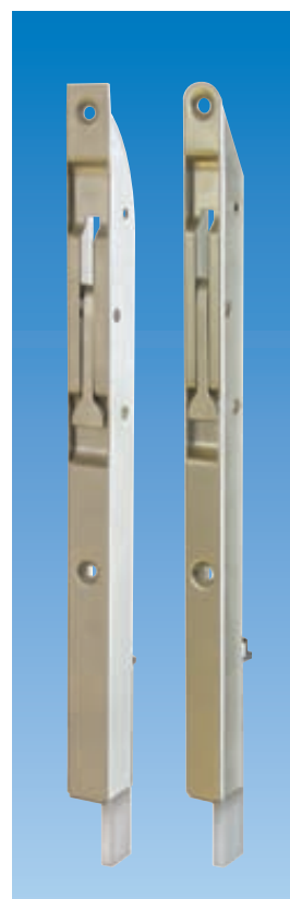
Planet KR (pasador). ver capítulo Pasador | Perforado