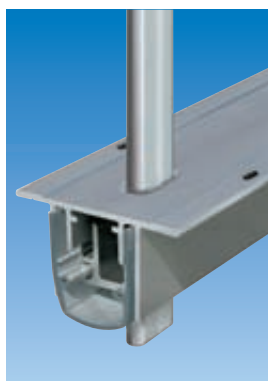
Planet R0 con falleba de 5x13 mm. Ver capítulo pasador | perforado; diferentes proveedores de fallebas de 5×13 mm