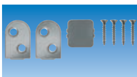
accesorios standard: Kit MF para puertas de madera