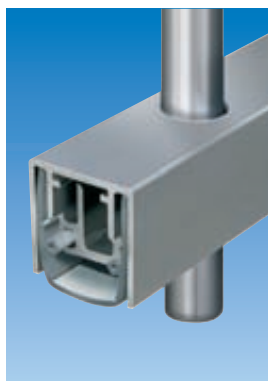
Planet MF con falleba Ø 10 mm. Ver capítulo pasador | perforado