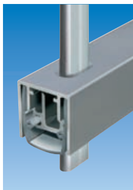
Planet MF con falleba de 5×13 mm. Ver capítulo pasador | perforado; diferentes proveedores de fallebas de 5×13 mm