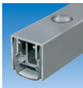
Planet MF con orificio redondo Ø 10,8 mm. Ver capítulo Planet KR | Perforado