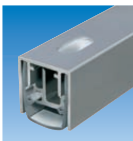
Planet MF con orificio 5×13 mm. Ver capítulo Planet KR | Perforado